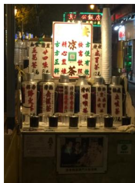
Fig. 10 Vendedor ambulante com vários tipos de chá de ervas.