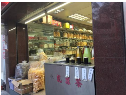
Fig. 9 Algumas farmácias tradicionais chinesas de Macau servem chá de ervas já preparado.